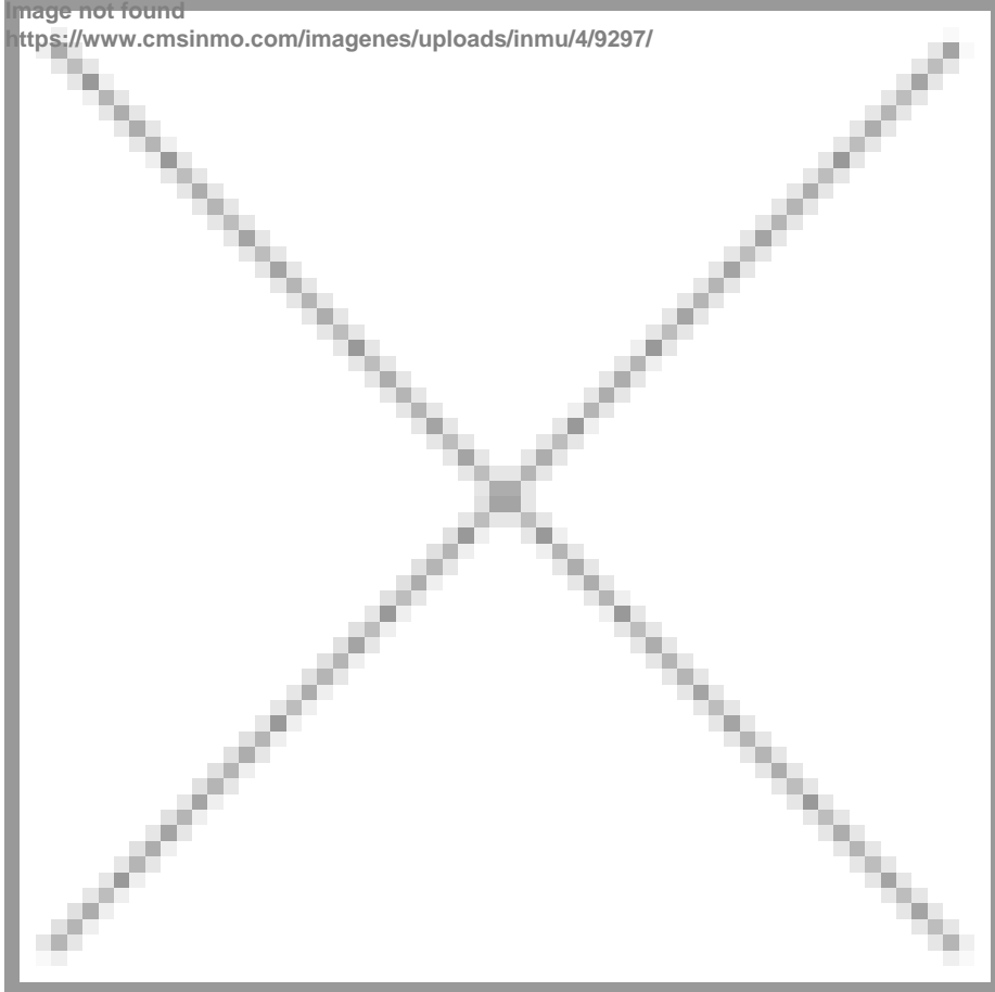
Image not found https://www.cmsinmo.com/imagenes/uploads/inmu/4/9297/