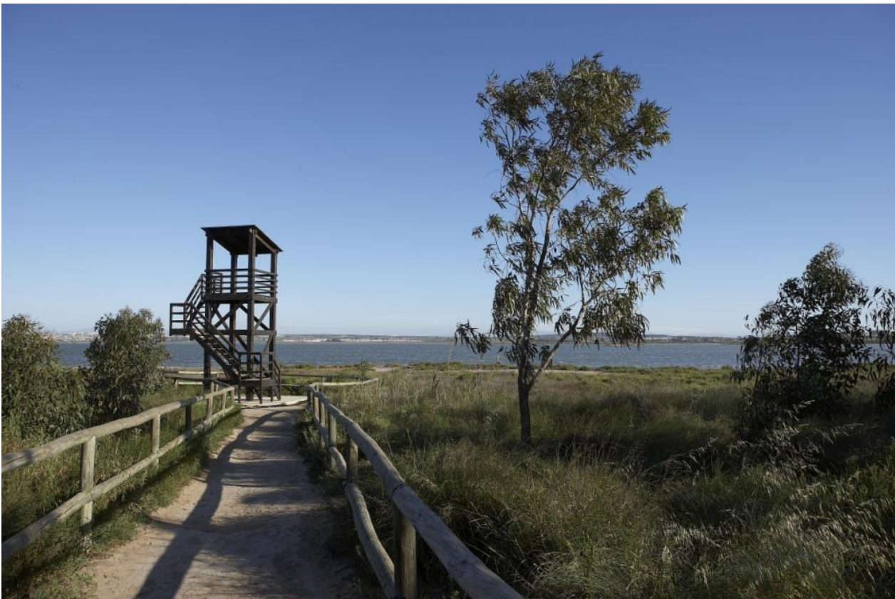
Imagen informativa sin escala / Informative image not scaled and subject to changes. Se reserva el derecho de modificaciones por motivos técnicos, jurídicos o comerciales.