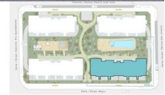
BLOQUE 1 - Solarium